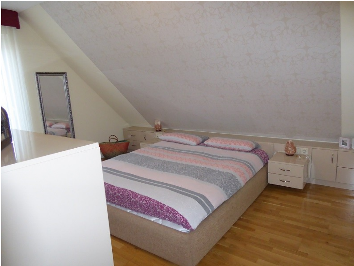
Schlafzimmer im Obergeschoss