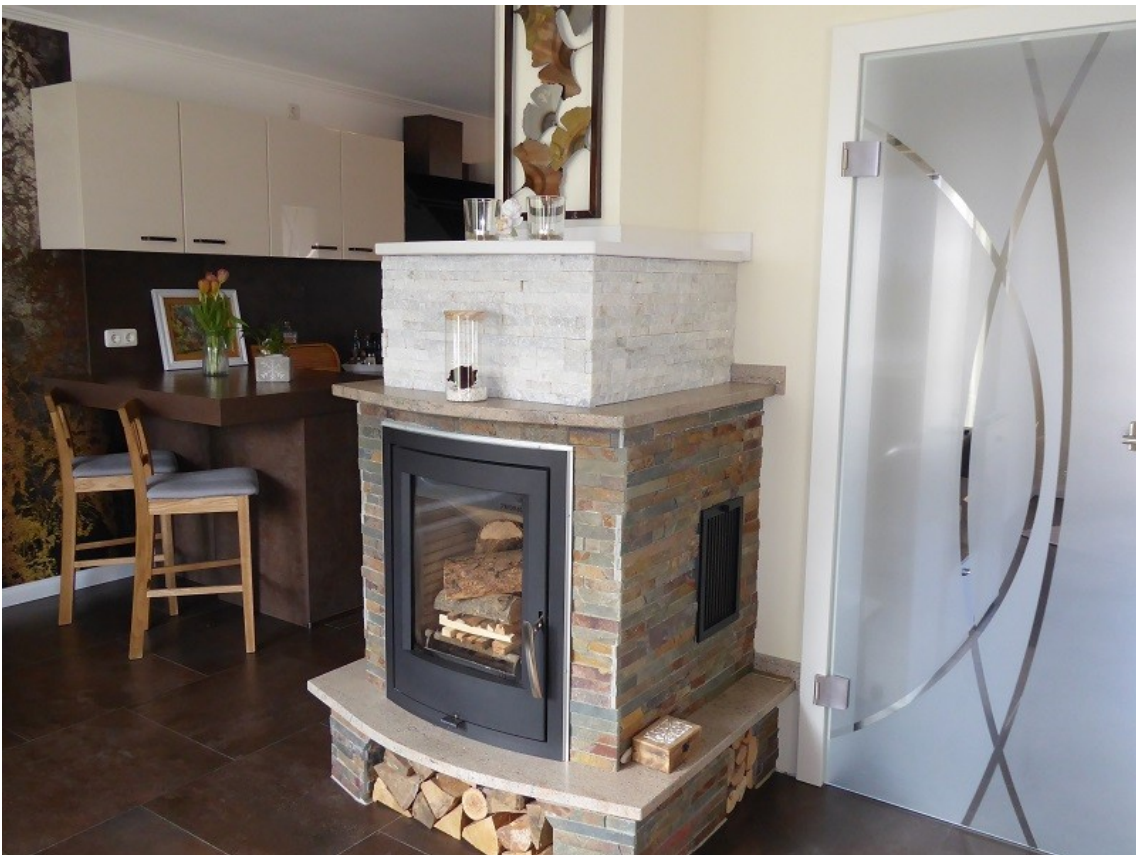
Kaminofen im Wohn- und Essbereich