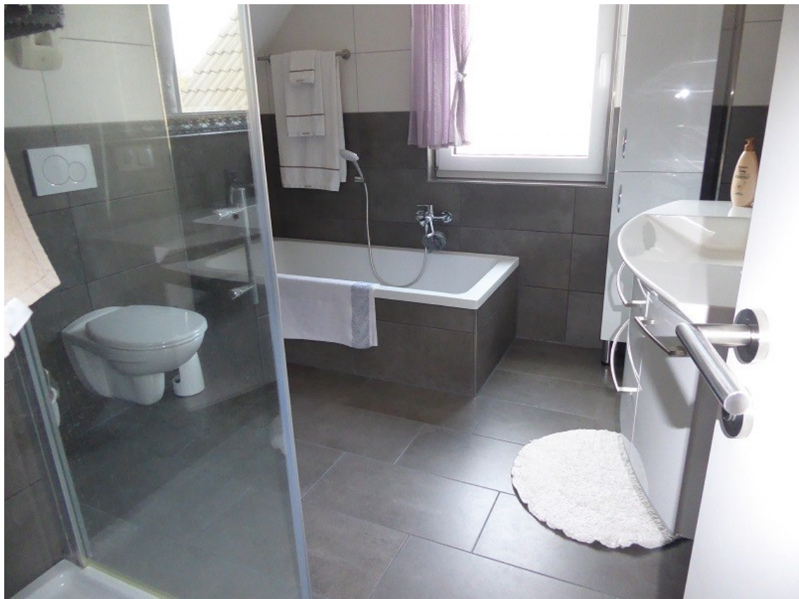
Badezimmer im Obergeschoss