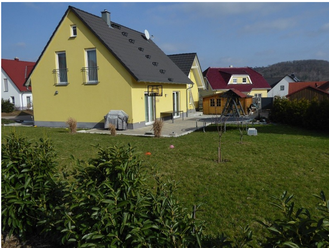
Ansicht vom Garten mit großer Terrasse