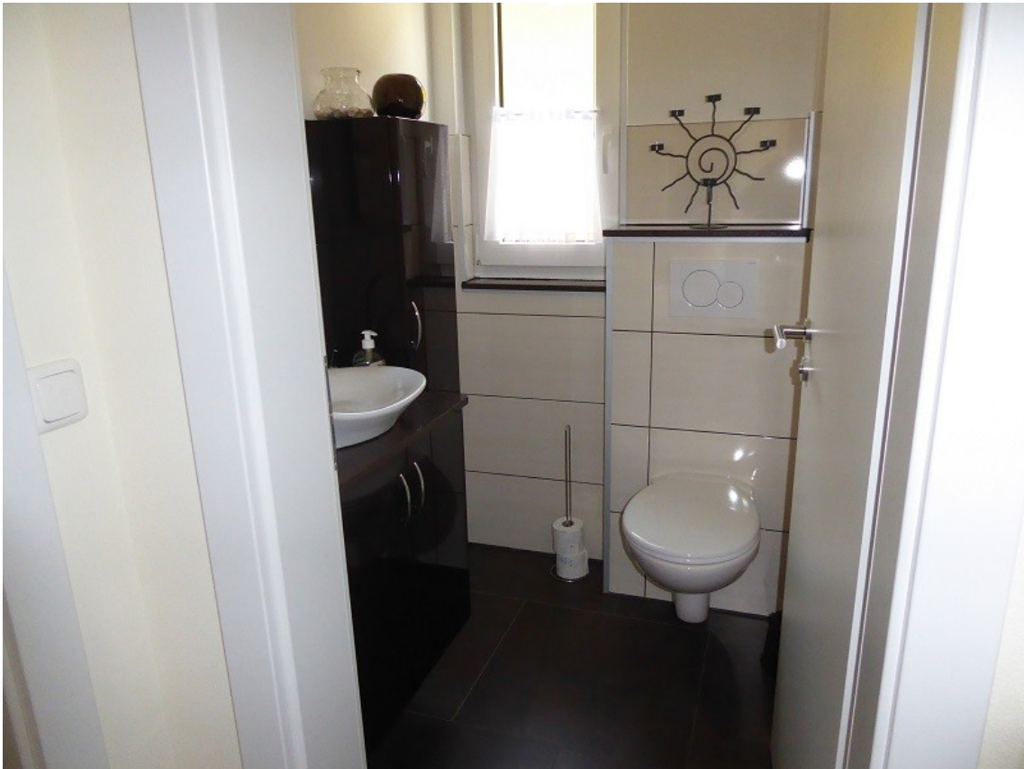
Gäste WC im Erdgeschoss