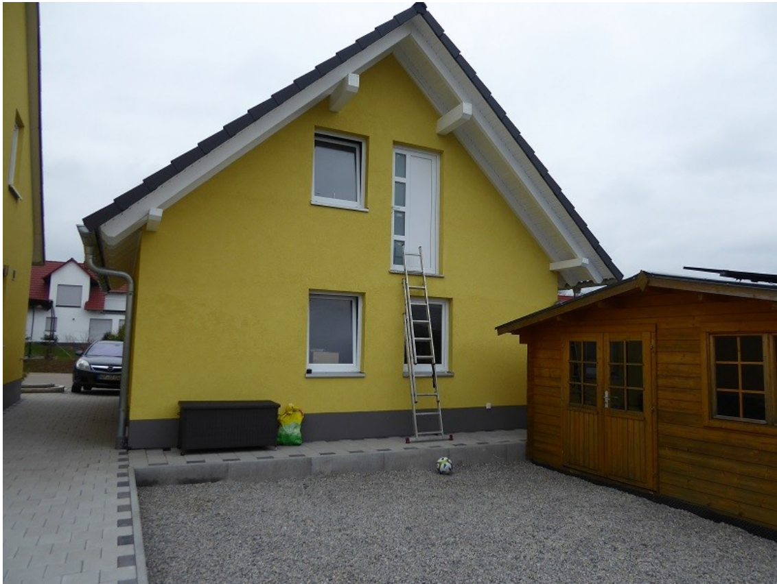
Rückansicht Doppelgarage mit Gartenhaus